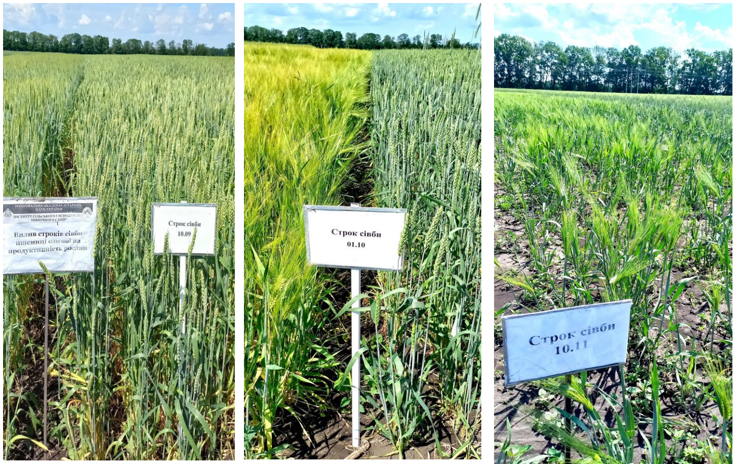
Рис. 3. Стан посівів озимих колосових культур за різних строків сівби: з ліва на право – 10.09; 01.10; 10.11